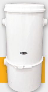
CE-1500 PB CE-1500 PB/TF

Premium CE1500PB maskiner med 23 liters uppsamlingspåse finns i 2 olika utföranden. Dels med s.k. by-pass motor (1500PB) som passar för placering i ventilerade utrymmen, och dels med s.k. Thru-Flow motor (CE-1500PB/TF) som kan placeras i slutet utrymme (ex. vis garderob) och kan förses med utblåsfilter för placering i lägenhet där möjlighet till avluft saknas. Båda typerna passar alla tänkbara hustyper och storlekar, och gärna där man önskar en låg placering av enheten då tömning sker uppifrån