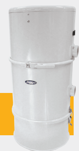
CE-1500 CS CE-1500 CS/PB

Premium CE 1500CS maskinerna med 15 liters uppsamlingsbehållare finns i 2 olika utföranden. Dels med cyklonavskiljning direkt till behållare (CE-1500CS) och när man av hygieniska eller praktiska skäl önskar ansluta 23 liters dammpåse (CE-1500CS/PB). Båda enheterna har s.k. by-pass motor för placering i ventilerade utrymmen och passar alla tänkbara hustyper och storlekar, och gärna där man önskar en hög placering av enheten då tömning sker under ifrån.