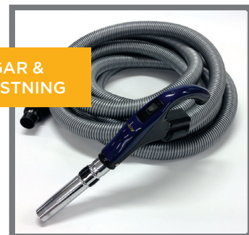
SUGSLANGAR & STÄDUTRUSTNING